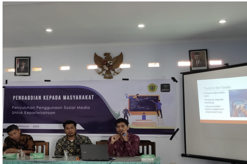
Gambar 4. Pemateri memberikan penjelasan secara lisan dan tulisan