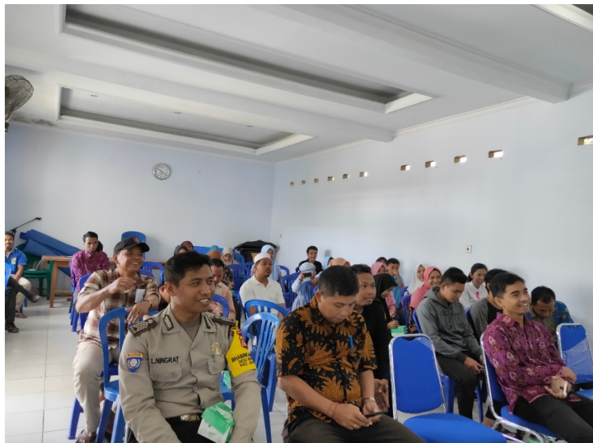
Gambar 5. Antusiasme peserta penyuluhan

Beberapa alasan menggunakan sosial media seperti yang dijelaskan pada slide ialah sebagai berikut: