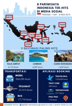
Gambar 6. Slide materi mengenai sosial media untuk kepariwisataan (1)

Daerah mana saja yang sering diperbincangkan?