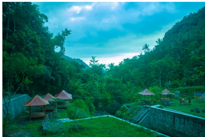
Gambar 3. Embung Teloke di Desa Batulayar [6]

Berdasarkan uraian tentang pemanfaatan media sosial untuk kepariwisataan, maka diperlukan suatu upaya untuk menjadikan sosial media sebagai wahana untuk memperkenalkan daerah wisata serta untuk memberikan informasi yang bermanfaat bagi wisatawan. Oleh karena itu penyuluhan penggunaan sosial media untuk kepariwisataan perlu dilakukan kepada masyarakat luas baik anak-anak, remaja, maupun orang dewasa