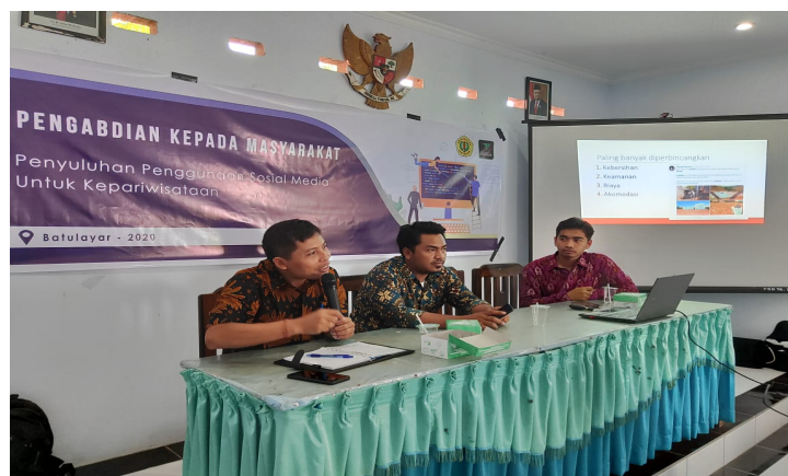
Gambar 3. Pemaparan hasil kajian oleh tim pemateri

Pemateri memberikan penjelasan terhadap materi yang disampaikan dalam bentuk diskusi dan juga melalui media pra-tayang. Kegiatan penyuluhan yang dilakukan mendapatkan respon dan antusiasme positif dari masyarakat mengenai diskusi tentang pemanfaatan sosial media untuk kepariwisataan, hal tersebut dapat dilihat pada Gambar 3, Gambar 4, dan Gambar 5. Dalam kegiatan penyuluhan yang dilakukan oleh tim, penjelasan materi disampaikan secara langsung menggunakan slide PowerPoint , seperti yang dapat dilihat pada Gambar 6 dan Gambar 7.